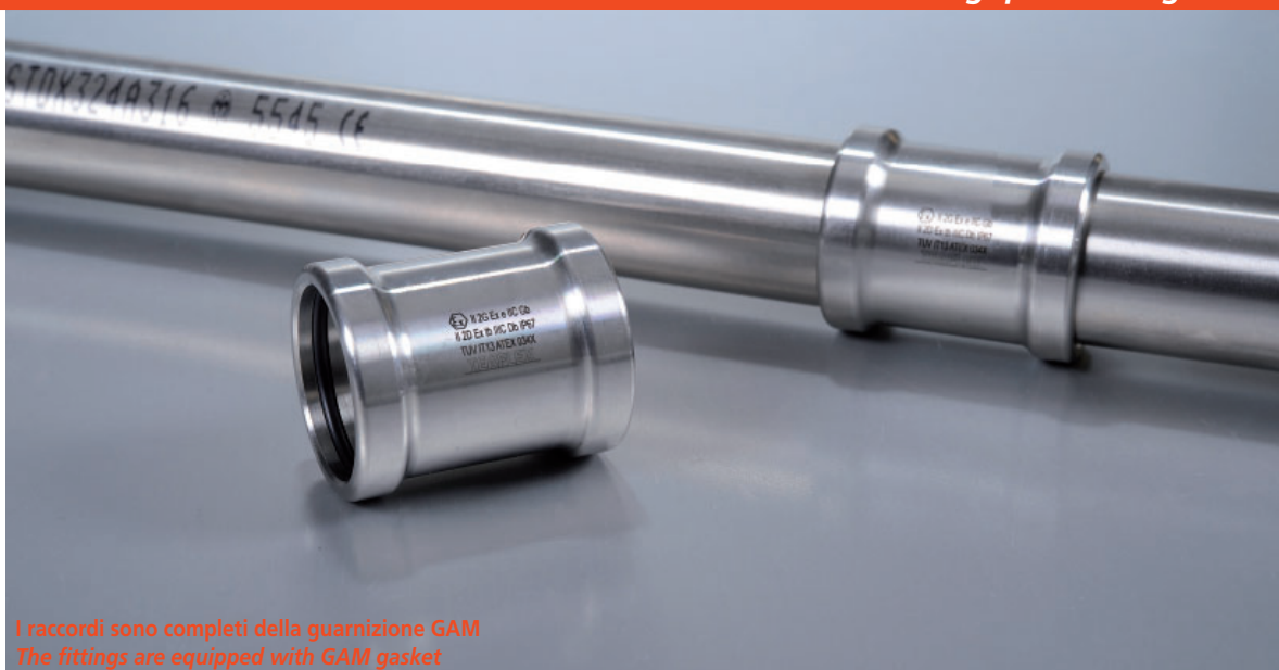
I raccordi sono completi della guarnizione GAM The fittings are equipped with GAM gasket